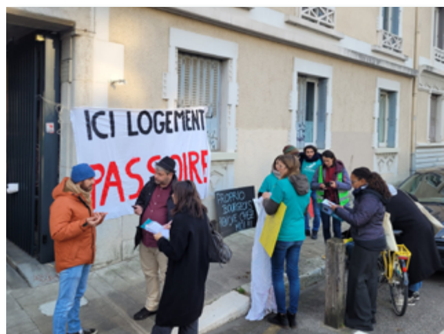
Une mobilisation avec les personnes concernées par l'Alliance Citoyenne à Grenoble.

Matin , quel journal ! est une revue de BD de Dargaud qui propose un strip par jour pour parler d'actualité, de géopolitique, de société, et de culture.