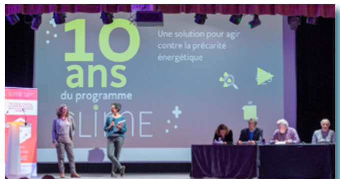
10 ans du programme Slime, pour le repérage et l'orientation des ménages.