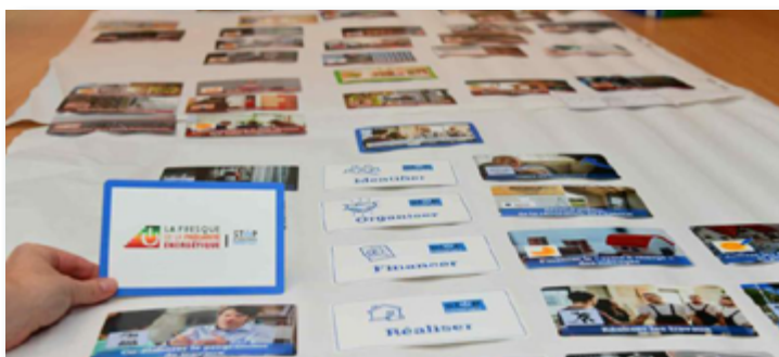
Des fresques de la précarité énergétique partout en France.