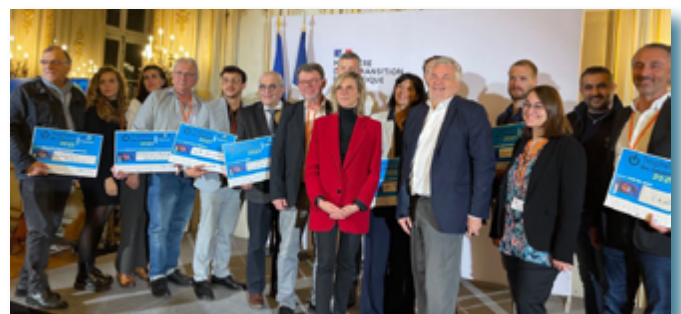
Remise des Trophées des Solutions par Stop à l'Exclusion Énergétique en présence de Mme Agnès Pannier Runacher, Ministre de la Transition énergétique.