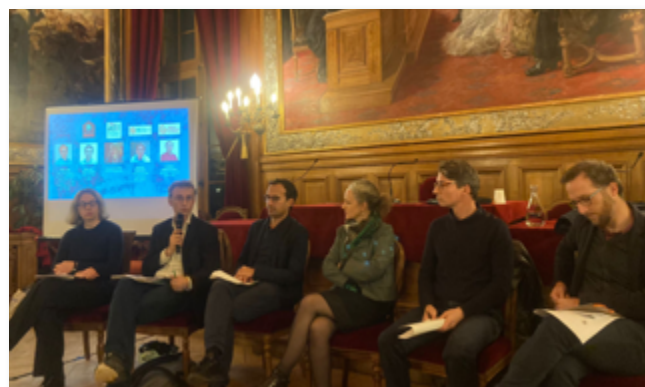
Table-ronde "Précarité énergétique à Paris : comment l'éradiquer ?" avec la Ville de Paris, la FAP, le CLER, l'ADIL de Paris et l'Agence Parisienne du Climat.