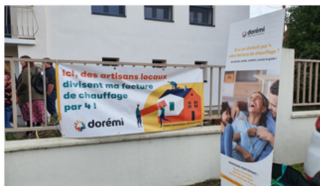
Des visites de chantiers avec Dorémi et Soliha.