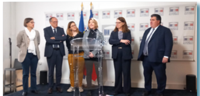
Conférence de presse à l'Assemblée Nationale : présentation d'une proposition de loi transpartisane pour interdire les coupures et protéger des consommateurs.

Une augmentation conséquente du nombre d'événements, et une mobilisation élargie sur plus de territoires !